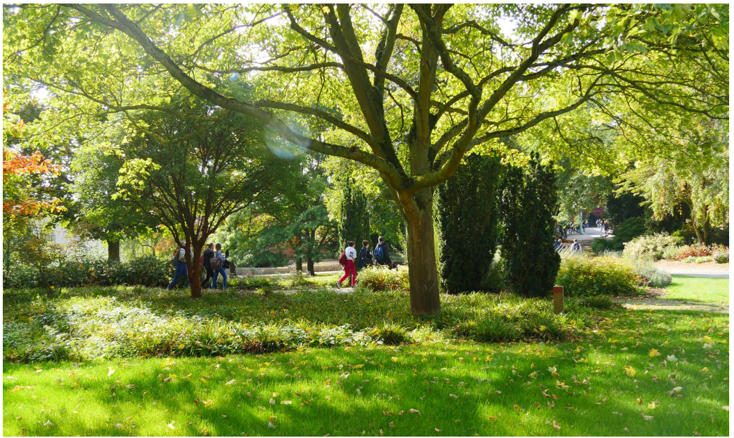
Un site arboré de 80 Ha