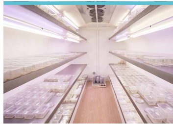
100 m 2 de chambres de culture