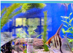
1 ferme pédagogique pour les soins animaliers (incluant une animalerie)