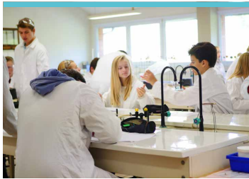
200 m 2 de laboratoires