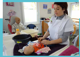
1 Plateau technique Service à la personne